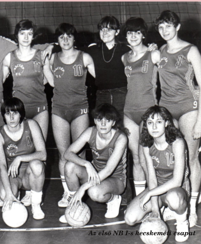
Az első NB I-s kecskeméti csapat