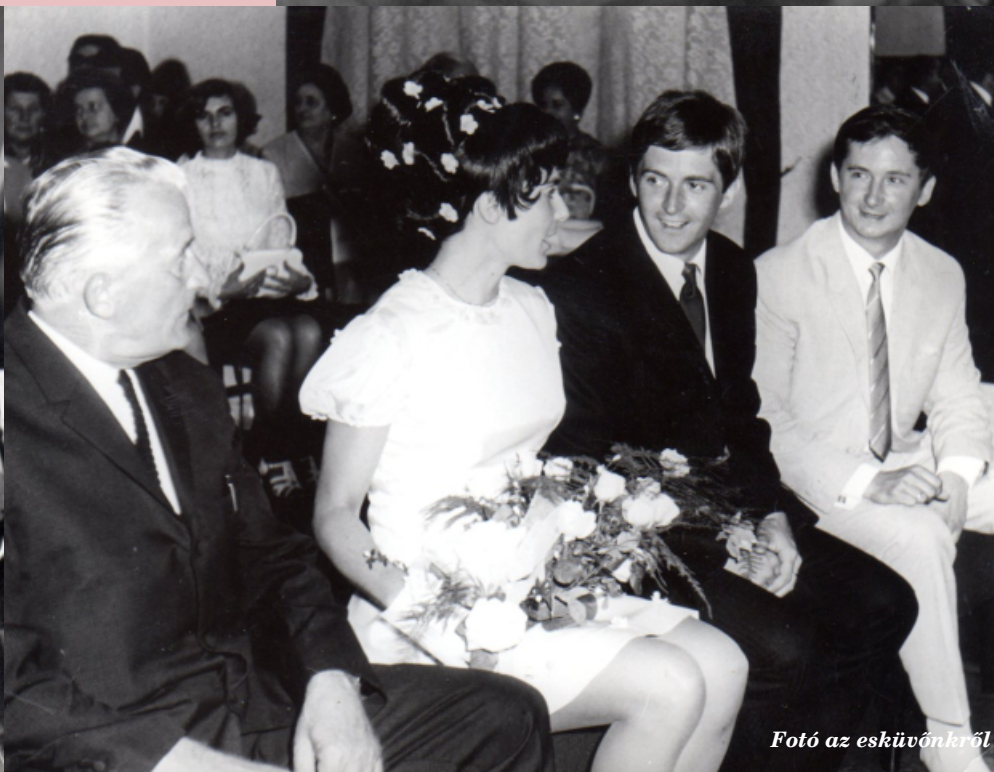
Fotó az esküvőnkől