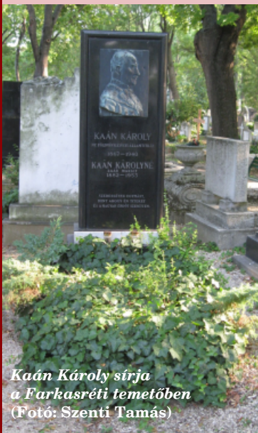
Kaán Károly sírja a Farkasréti temetőben

Az erdészeti szakemberek által az „alföldfásítás nagy apostolaként” emlegetett Kaán Károly Budapesten hunyt el 1940. január 28-án. Emlékére az Országos Erdészeti Egyesület a nevét viselő díjat alapított. A Pilisben és a Bükkben forrás őrzi nevét, és róla neveztek el a szentgyörgyhegyi turistaházat és a Nagy-Hárshegyen épült kilátót is. Emléktáblája van Budapesten, szobra Püspökladányban, Mezőtúron és Nagykanizsán is. Emlékére az általános iskolák 5. és 6. évfolyamosai számára évente megrendezik a Kaán Károly országos természet- és környezetismereti versenyt. Munkásságát 2012-ben Magyar Örökség Díjjal tüntették ki.