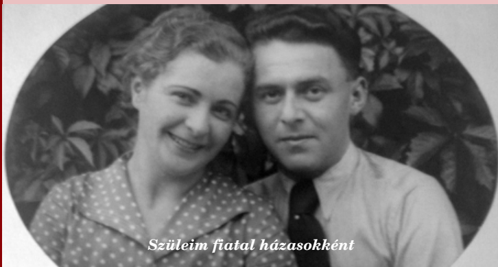
Szüleim fiatal házasokként