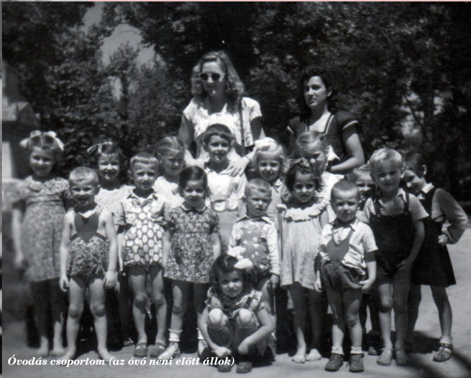
Óvodás csoportom (az óvó néni előtt állok)