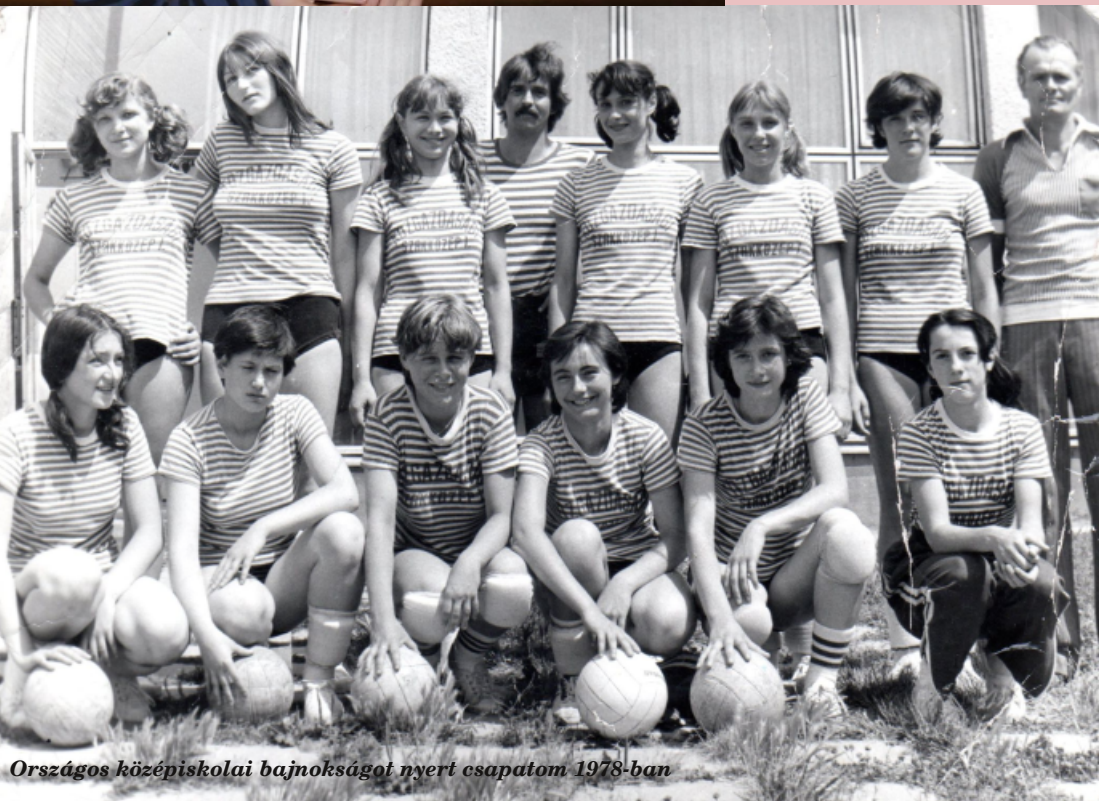
Országos középiskolai bajnokságot nyert csapatom 1978-ban