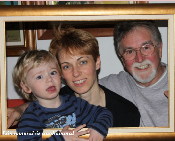
Lányommal és unokámmal

A rendszerváltozás után dr. Sárközy István igazgató ajánlatát elfogadva az újrainduló Kecskeméti Református Gimnázium tanára lettem, 1991-től nyugdíjba vonulásomig, 2011-ig ott tanítottam. Olyan közegbe kerültem, amely alapvetően, minőségileg változtatta meg az életemet. 1992-ben felnőttként konfirmáltam, néhány évvel később a presbitérium tagjává választottak, 16 éven át a Szíj Rezső – Kovács Rózsa Gyűjtemény gondnoka lehettem. Az iskola életébe a röplabda is beépült, lányommal 1994-től együtt tanítottam, de nyugdíjasként még napjainkban is rendszeresen edzést tartok egy csoportcsábítottam Kecskemétre,